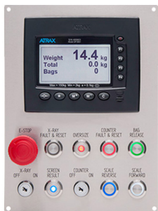
智能值机控制面板